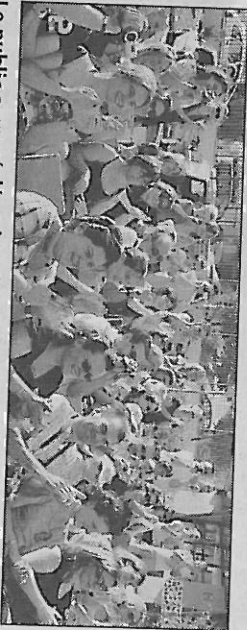
Le public a apprécié et les photos et vidéos n'ont pas faibli

leurs camarades de l'année, sur des lectures d'affiches de la sécurité routière, sur leur propre vécu et autres documents... Puis ils ont inventé des slogans, réalisé les illustrations et la classe a finalement choisi deux affiches qui lui semblaient les plus représentatives pour participer à ce concours. Patricia Cassagnes-Skorupski, enseignante de la classe de CM2 lauréate et directrice de l'école.